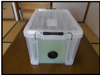
特製バッテリーケースです。 今回WSより標準付属品。

3・11の災害の時には、 ガソリンが入手できなくなりました 。 夜間に発電機を回すことは、騒音の問題を考えると簡単にはできません。カセット式ガス発電機は空き缶の「ごみ」を増やすことになります。