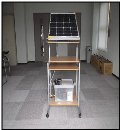
手動ですが太陽光に合わせて取り入れ角度・方向を調整できます。（使用例）